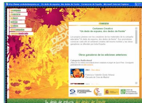
Imagen de la nueva Web. undedodeespuma.es

A medida que se vayan recibiendo obras, éstas se irán colgando en la Web, si bien la votación únicamente podrá realizarse cuando haya finalizado el plazo de entrega de las mismas (29 de junio), para que todos los participantes tengan las mismas oportunidades.