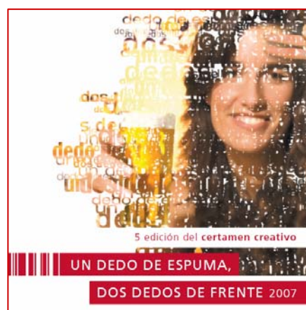
Imagen de las bases del certamen 2007